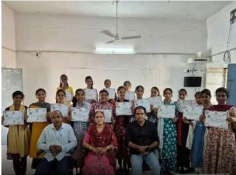
శ్రీకాకుళం జిల్లా వార్తలు. వే2న్యూస్. డాట్స్ డి. way2news way2.col/nmz4f