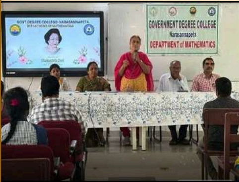
శ్రీకాకుళం జిల్లా వార్తలు... వే2న్యూస్ లో డౌన్ లోడ్ way2.co/tnq3ku