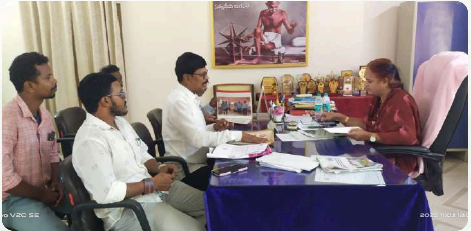
PRINCIPAL & STAFF ATTENDING ONLINE TRAINING ON ARTIFICIAL INTELLIGENCE BY CCE