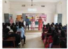
వే2న్యూస్ శ్రీకాకుళం జిల్లా వార్తల కోసం డాక్టర్ మీ24న్యూస్ (Mee24News)