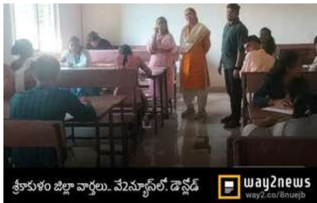
శ్రీకాళం జిల్లా వార్తలు. వేమన్నాస్ లో డాన్స్ డ్ way2news way2.co/8nu6jb