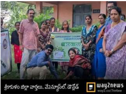
శ్రీకాకుళం జిల్లా వార్తలు... వే2న్యూస్ లో డౌన్ లోడ్ way2.co/7trbbe